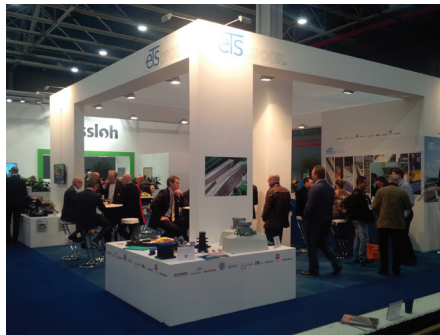
레일 기술, 네덜란드