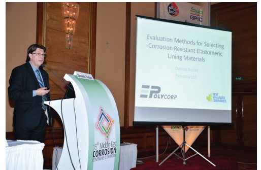
중동 부식 회의, 바레인